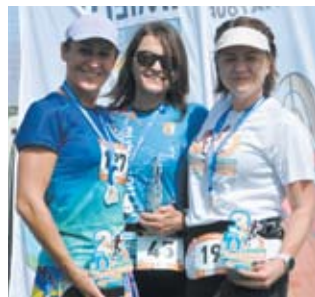
Najszybsze z Imielina w biegu na 10 km

Tymczasem na boisku rozłożyła się, jak w ubiegłym roku, wioska sportowa. Studenci AWF-u i wolontariusze organizują rozgrzewki dla dzieci, które będą startować w biegach, a po zawodach zapraszają do gier i zabaw oraz poczęstowania się owocami i warzywami.