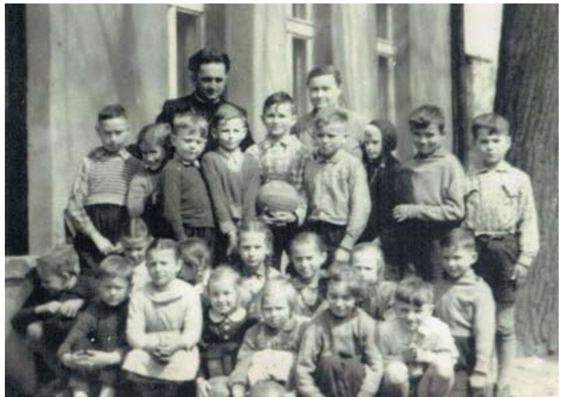
Piłka już jest, za chwilę z księdzem pójdą grać na Földową Górę.

Zimą parę razy wszystkie cztery klasy razem z wychowawczy-