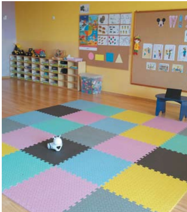
W przedszkolu zmieniono wyposażenie wszystkich sal.

Początek roku szkolnego poprzedziły jak zwykle zebrania z rodzicami. W tym roku szkolnym ich organizacją została dostosowana do obowiązujących wymogów bezpieczeństwa. Zostali na nie zaproszeni chętni rodzice dzieci najmłodszych, którzy po raz pierwszy przekraczają progi przedszkola. Aby zapewnić rodzicom możliwość zachowania odstępstwa społecznego, zorganizowano je w dwóch turach. Rodzice