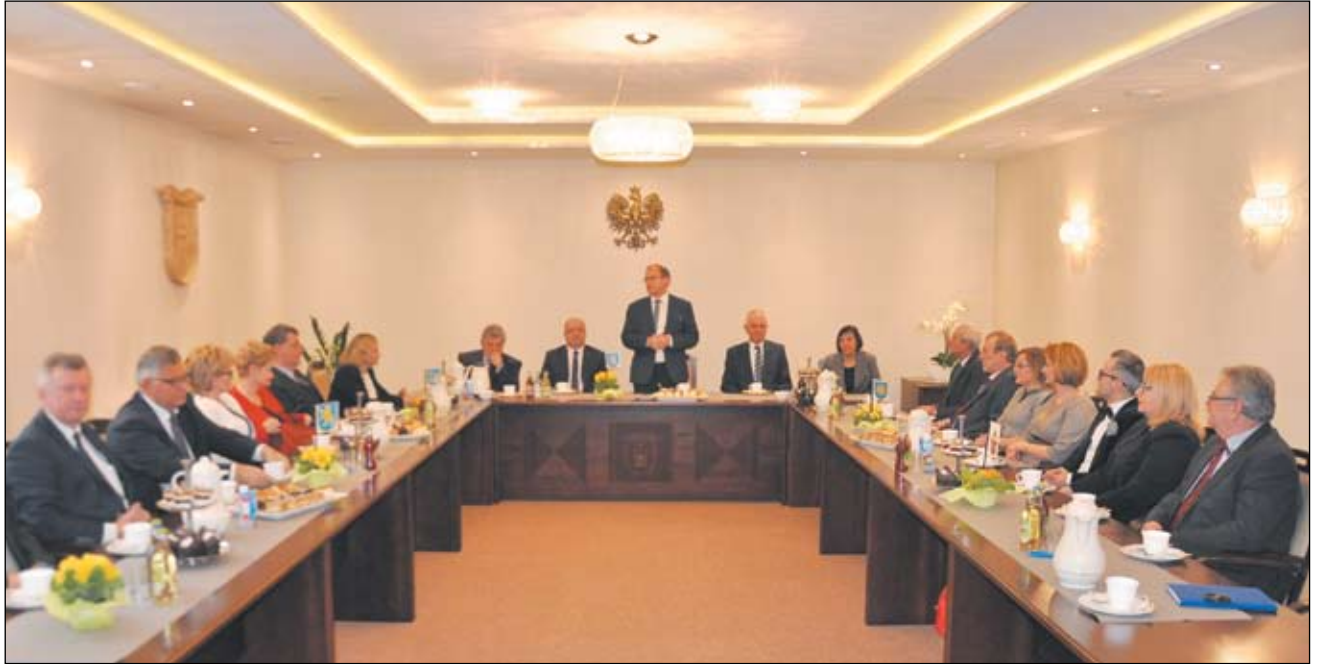
Podczas spotkania w sali sesyjnej Urzędu Miasta w Imielinie.