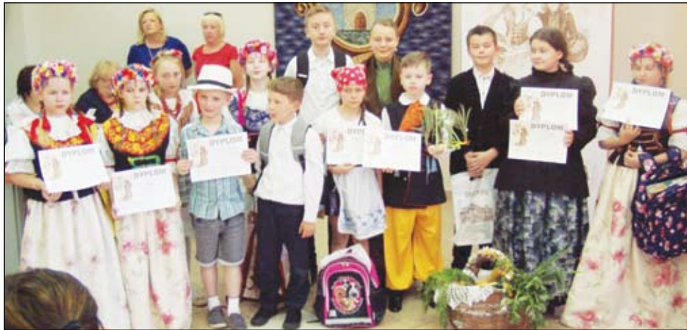
Uczestnicy konkursu „Jak to dawniej bywało” z Imielina.