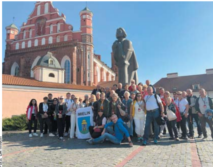
Uczestnicy wycieczki w Wilnie przy pomniku Adama Mickiewicza

Nasza przygoda rozpoczęła się późnym wieczorem 20 września, gdy grupa pełna entuzjazmu wyruszyła z Imielina w kierunku Wilna. Po przyjeździe do stolicy Litwy, od razu udaliśmy się na zwiedzanie. Przeszliśmy się ulicami Starego Miasta, podziwiając zabytkowe kamienice i liczne kościoły, w tym majestatyczną Katedrę Wileńską. Następnie zobaczyliśmy Muzeum Adama Mickiewicza mieszczące się w domu, w którym mieszkał romantyk oraz Uniwersytet Wileński, gdzie przewodnik opowiedział nam o historii uczelni i jej znaczeniu dla kultury i nauki regionu. Ostatnim przystankiem była Ostra Brama - jedno z najważniejszych miejsc kultu religijnego w Wilnie. Byliśmy pod wrażeniem atmosfery tego miejsca oraz pięknych ikon. Dzień zakończyliśmy wspólną kolacją w lokalnej restauracji, smakując tradycyjnych litewskich potraw.