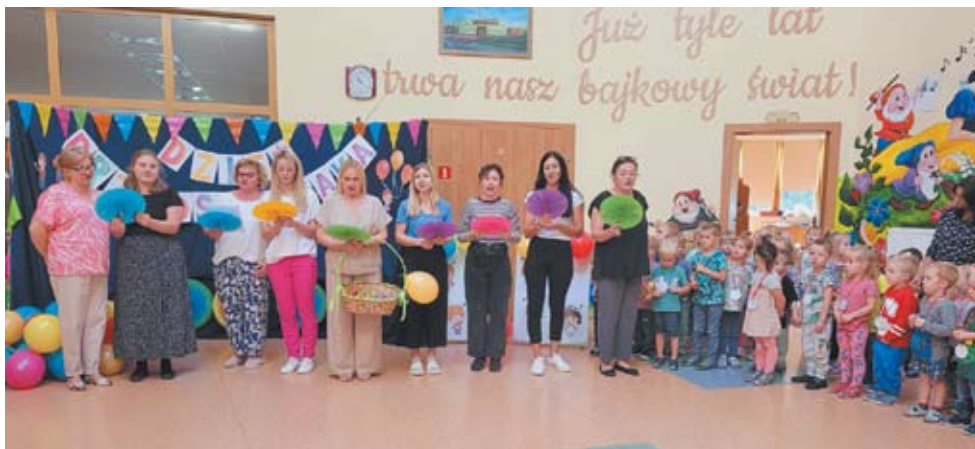
Życzenia na Dzień Przedszkolaka

Dzień Kropki dzieci świętowały 16 września. Wcale nie chodzi w nim o kropkę, lecz o wspieranie dzieci w odkrywaniu swoich mocnych stron i pozytywnym postrzeganiu siebie. Wszystko to w toku zabaw z kropką, w których wzięły udział nawet najmłodsze dzieci, poznając temat na miarę swoich możliwości rozwojowych. Nie zabrakło bajki o Vashti i kreatywnych prac plastycznych. Bo talenty, pasje