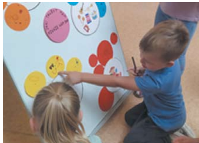
Jaki mam talent

Dzieci i nauczycielki z przedszkola przebrały się w piękne jesienne stroje, były wspólne zabawy, teatryk, zdjęcia, a w holu przedszkola powstała kolorowa jesienna wystawa. (kw, af)